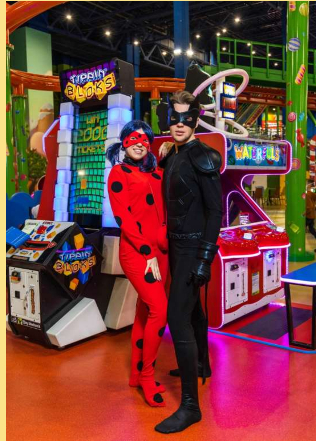
ЛЕДІ БАГ І СУПЕР-КІТ