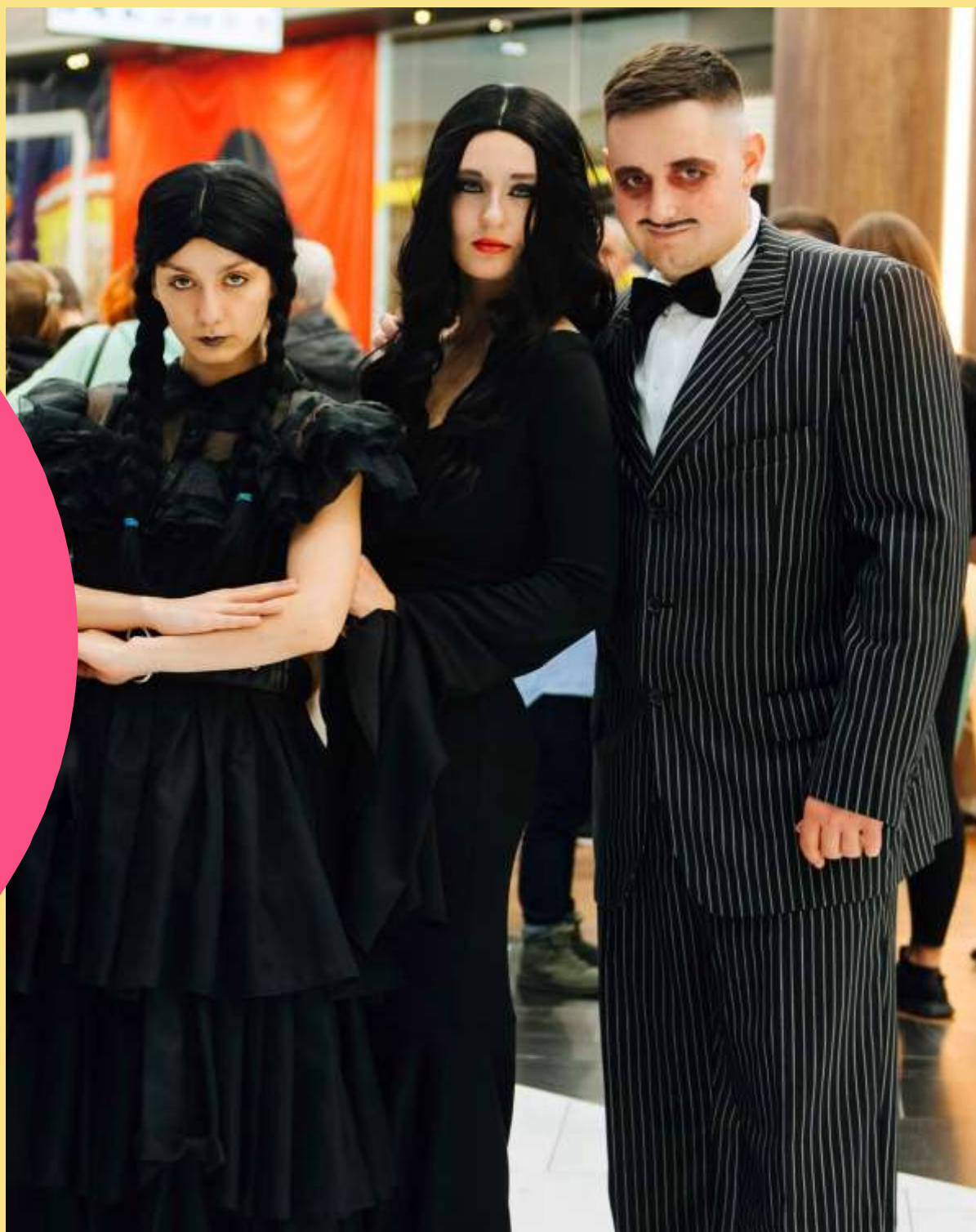
ГОМЕС ТА МОРТИША