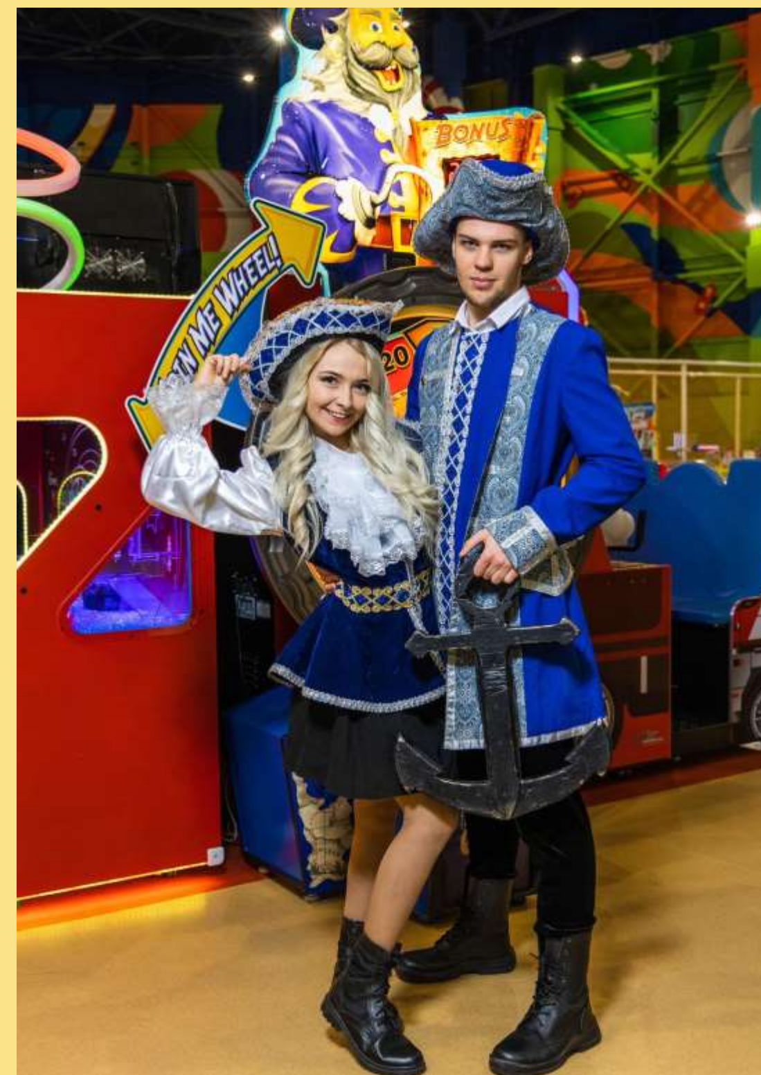
АДМІРАЛ ТА ПІРАТКА