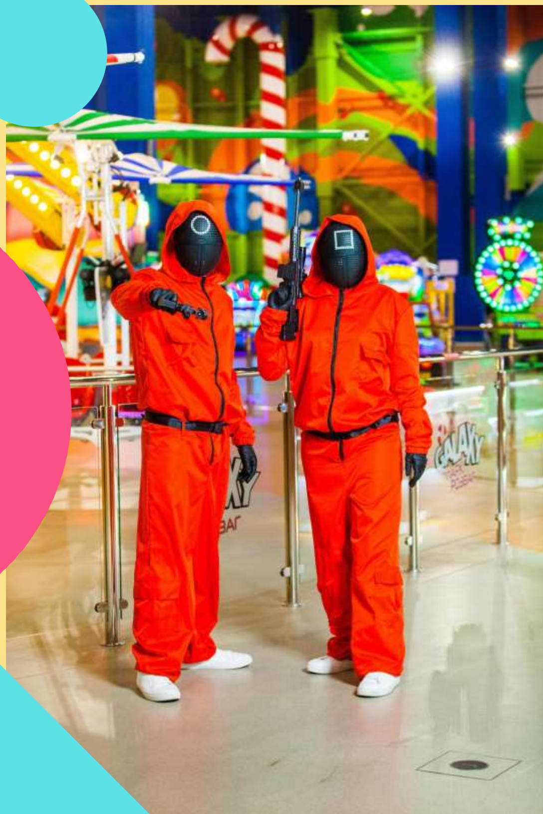
ГРА В КАЛЬМАРА