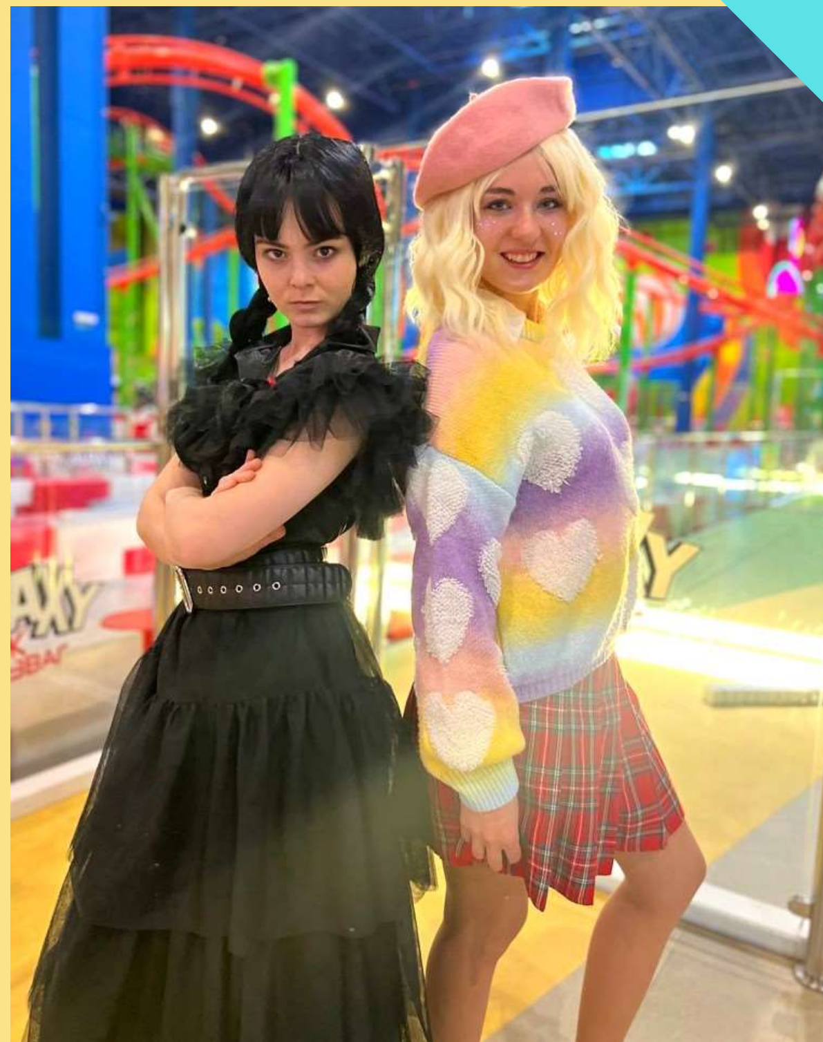
ВЕНЗДЕЙ ТА ЕНІД